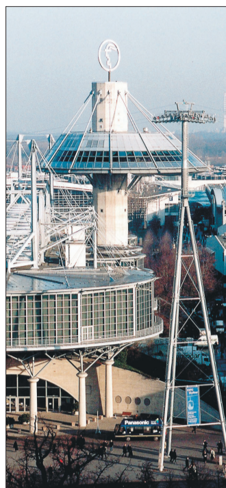
Die Hannover Messe ist und bleibt das weltweit wichtigste Technologieereignis des Jahres.

Unter dem Dach der Hannover Messe präsentiert sich alljährlich ein thematisch gebündeltes Spektrum von Hightech-Leitmessen. Dazu gehören neben der INTERKAMA+ und der Factory Automation die Digital Factory, die MicroTechnology, die Subcontracting, die Energy und die Research & Technology. Im Zwei-Jahres-Turnus präsentieren sich Motion, Drive & Automation, Compressed Air & Vacuum Technology sowie Surface Technology mit Powder Coating Europe. Diese Leitmesse sind jeweils die weltweite Nummer eins ihrer Branche. Die Hannover Messe bildet das Dach für ein Networking zwischen diesen Communities durch die Nutzung ihrer Synergieeffekte.